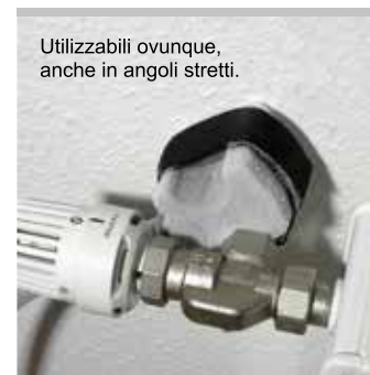
Utilizzabili ovunque, anche in angoli stretti.